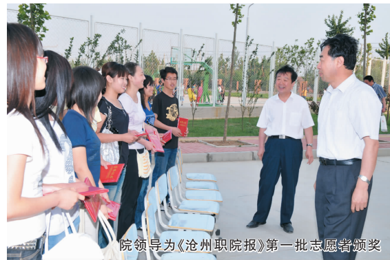
院领导为《沧州职院报》第一批志愿者颁奖

“快毕业了”这四个字说出口时,心里真的有些酸楚。凭栏回首,三年的大学生活即将结束了,想起刚刚进入沧州职业技术学院的第一天,自己还是一个懵懂无知的小丫头,根本不懂什么是生存,更不知道自己的人生该何去何从,只是一味的幻想着以后的生活会像漂浮在水盆里的纸船一样,没有风浪,没有波涛,能够顺利的游到理想的彼岸,现在想到那时的自己,真的很天真、很单纯。