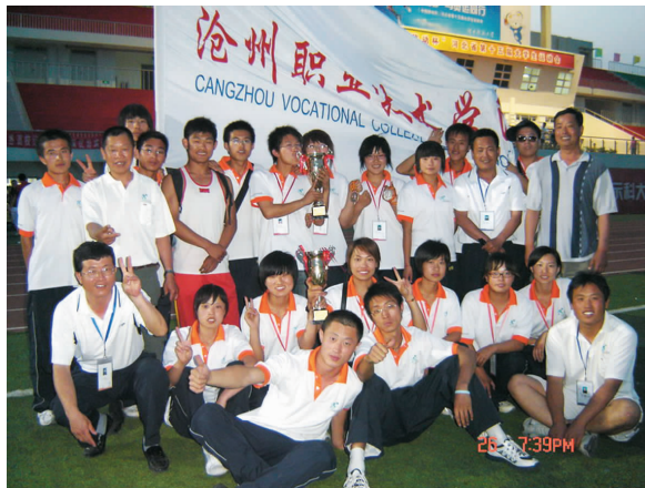
我院参赛运动员、教练员合影