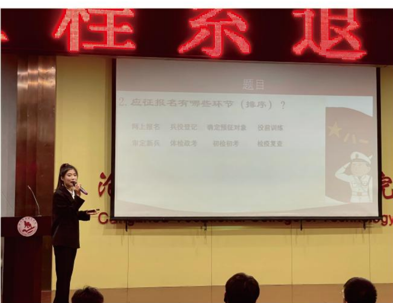
12月7日, 车辆工程系为响应“参军入伍, 报效祖国”的国家号召, 加大征兵宣传力度