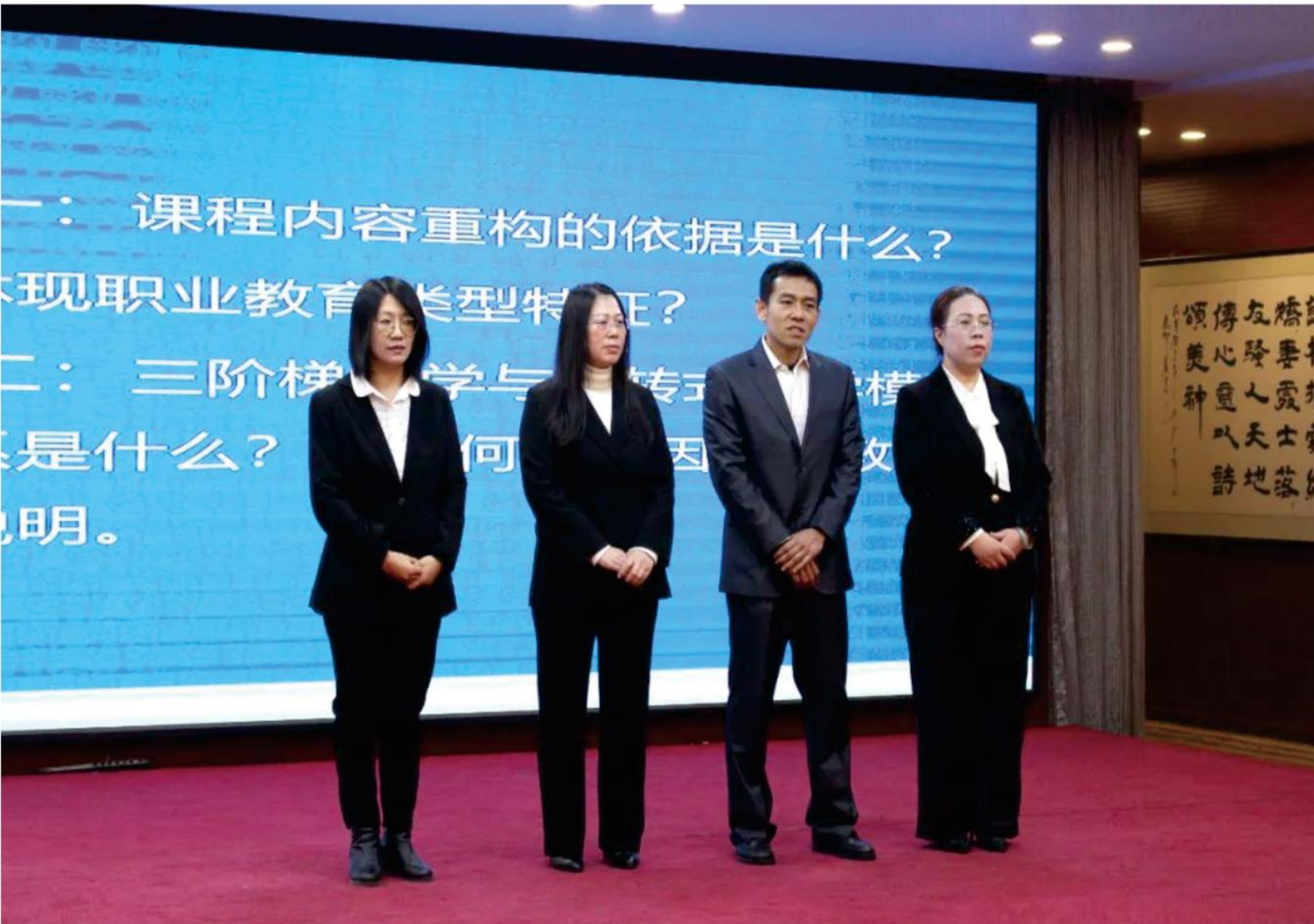
2024年沧州职业技术学院教师教学能力比赛获奖名单